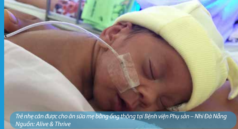
Trẻ nhẹ cân được cho ăn sữa mẹ bằng ống thông tại Bệnh viện Phụ sản – Nhi Đà Nẵng