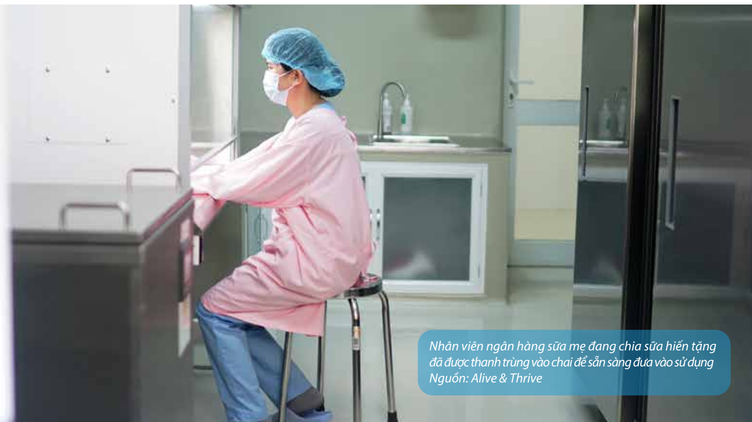
Nhân viên ngân hàng sữa mẹ đang chia sữa hiến tặng đã được thanh trùng vào chai để sẵn sàng đưa vào sử dụng

WHO. Guidelines on optimal feeding of low birth-weight infants in low- and middle-income countries. Geneva, World Health Organization; 2011. Available from www.who.int/elena/titles/full_recommendations/feeding_lbwt/en .